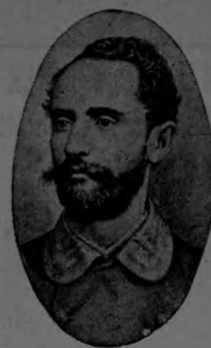
General don Tomás Guardia